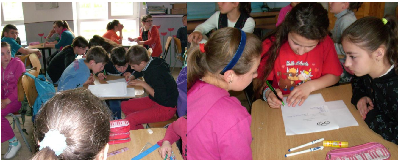
Clasele primare Să descoperim, să inventăm