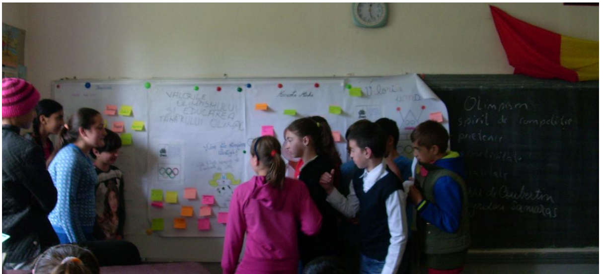
Clasele primare – simbolurile olimpice DECHIDERA FETIVĂ A SĂPTĂMÂNII OLIMPISMULUI